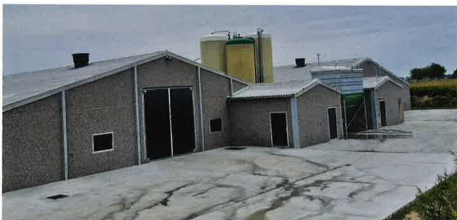
Het nieuwe verzorgde bedrijf telt 2 stallen voor samen 84.000 reguliere braadkippen.

De ouders van Delphine baten sinds '85 een gemengd bedrijf uit met melkvee, braadkippen en akkerbouw in het landelijke Adinkerke nabij Veurne. Doordat het ouderlijk bedrijf tegen een natura2000-gebied ligt - oranje PASbrief - waren de opties om op de ouderlijke locatie uit te breiden zeer beperkt en besloten ze uit te wijken naar een nevenexploitatie op zo'n 2 km. Dit om meer bedrijfszekerheid te hebben.