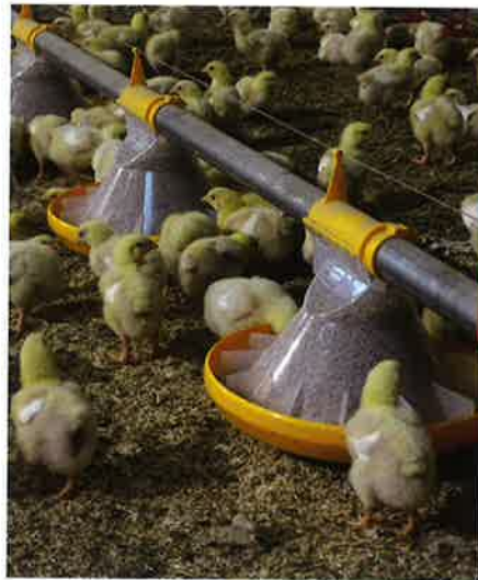
Er is gekozen voor Landmeco voederpannen en Lubing drinklijnen.