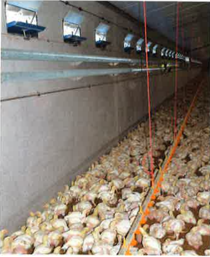
De stallen zijn uitgerust met spiraflex buizen voor de verwarming en nevelkoeling met 2 nozzels boven iedere luchtinlaat.