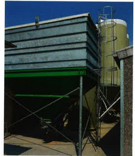
Een tarwebak is voor de voedersilo's geplaatst om vlot de eigen tarwe te kunnen inmengen.

met de eigen tarwe voor ongeveer 4 tot 5 maanden, afhankelijk van de opbrengst. Samen met een goede voederconversie, is dit immers duurzaam produceren”.